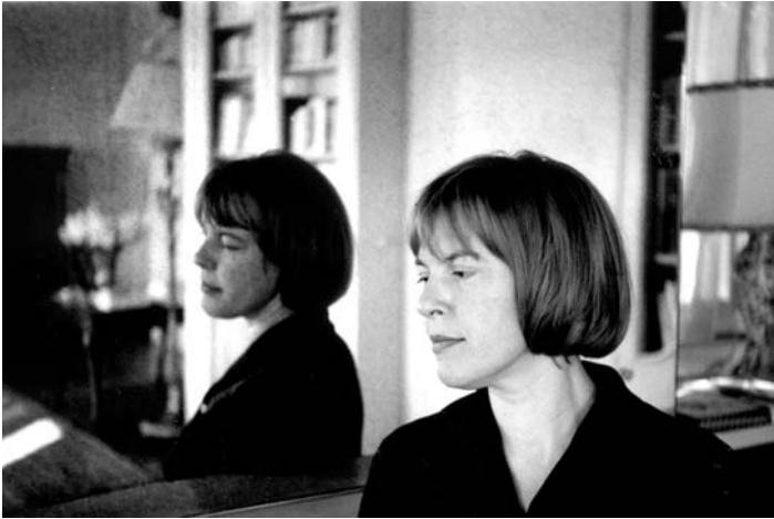
Ingeborg Bachmann – evangelisch A.B.

semitischen Atmosphäre zum christlichen Glauben konvertiert sein. Arnold Schönberg, Egon Fridell oder Hugo Bettauer sind nur einige von ihnen. Burgtheater, Prater, Universität